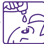
容器の先と目やまつ毛がふれることのないように